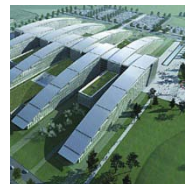
NAVO HQ EVERE